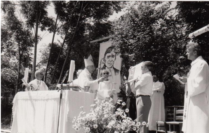
Fête du Bicentenaire de La Naissance de Frère Polycarpe à La Motte le 24 Juin 2001 -Mgr Lagrange présidant la Messe-

On dénombre aujourd'hui, 255 communautés à travers le monde (34 pays) et 1200 frères. Ils sont présents dans les pays en voie de développement où ils enseignent. En Europe et en Amérique du Nord ils s'occupent surtout des jeunes en difficultés. Mais leur mission est toujours et partout la même: se mettre au service des plus pauvres.