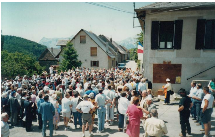
Fête du Bicentenaire de La Naissance de Frère Polycarpe à La Motte le 24 Juin 2001 - Inauguration de la plaque commémorative place de la Mairie -